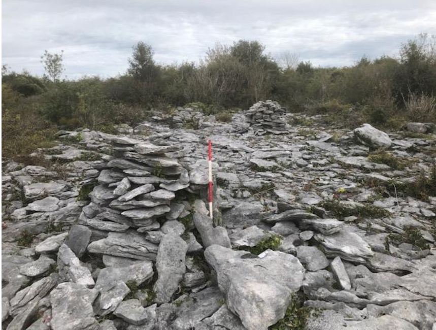
Pláta 3: CH B, ag féachaint ó thuaidh