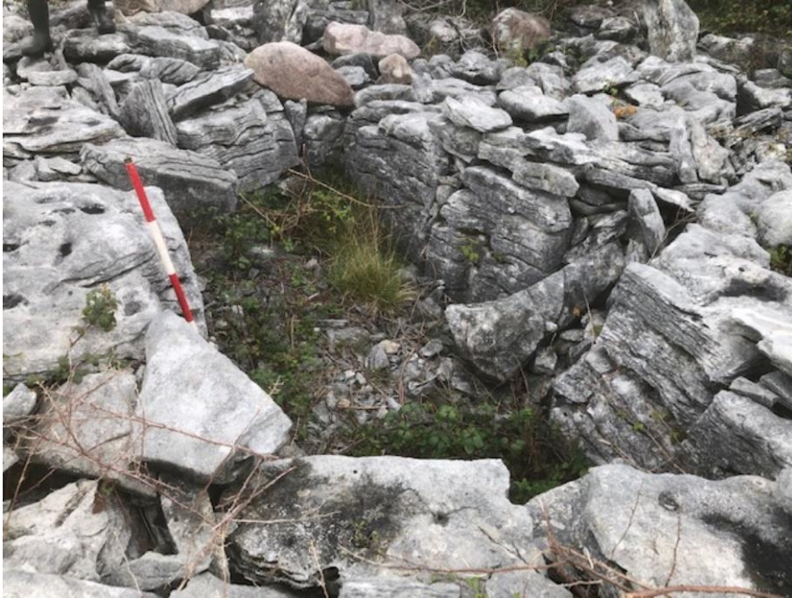
Pláta 4: CH C, ag féachaint siar ó dheas