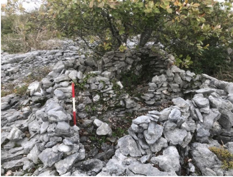
Pláta 5: CH D, ag féachaint siar ó thuaidh