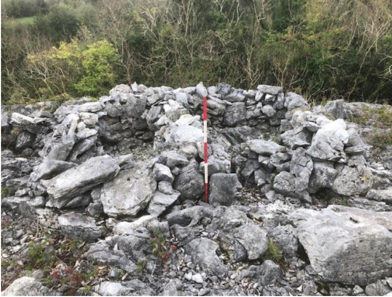
Pláta 6: CH C, ag féachaint siar ó dheas