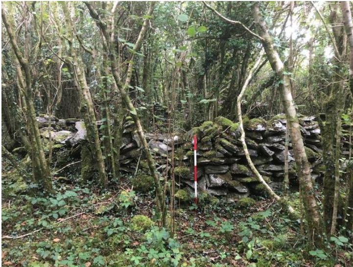
Pláta 1: CH A, ag féachaint soir ó thuaidh

Níl teorainn na páirce a bhfuil an láithreán tadhlach léi ann ar an gcéad eagrán de léarscáil na Suirbhéireachta Ordanáis sa bhliain 1841, ach tá sé marcáilte ar léarscáil 1895-1900. Tugann sé sin le fios gurb é an dáta is luaithe a bhaineann leis an ngné seo dáta i lár an 19ú haois, cé nach bhfuil sí marcáilte ar aon cheann de na léarscáileanna stairiúla. D'fhéadfadh sé gurb ionann an t-imfhálú agus iarsmaí póna nó imfhálaithe le haghaidh beostoic agus ba ghné choitianta den tírdhreach iar-mheánaoiseach na nithe sin, go háirithe ar thír-raon imeallach, amhail an ceantar fairsing thart ar an láithreán ina raibh ainmhithe in ann gluaiseacht thart ann.