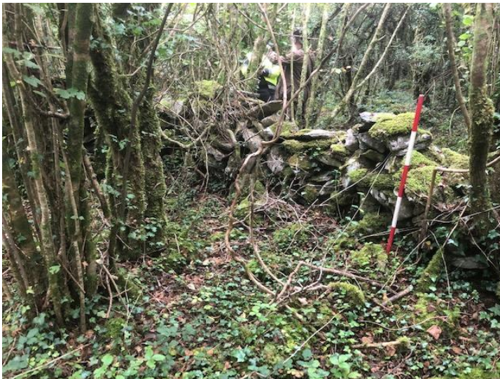
Pláta 2: CH A, ag féachaint siar ó dheas